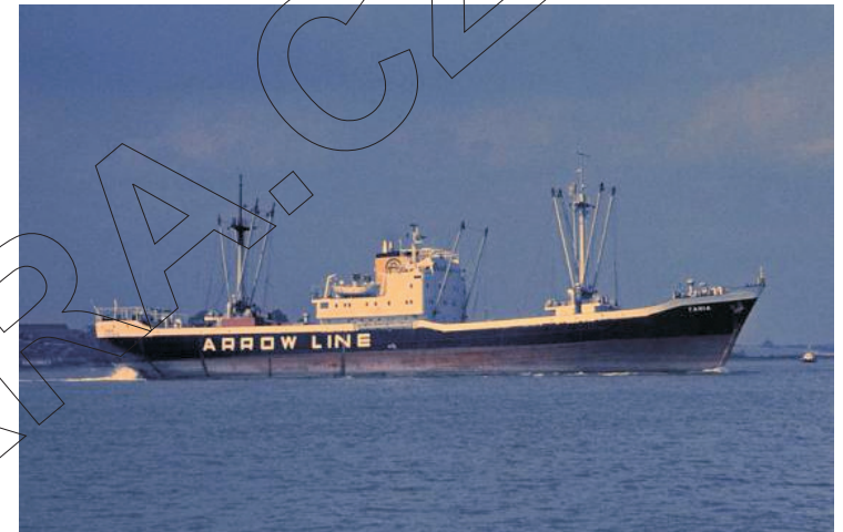
ELHAWI STAR ještě pod jménem TANIA