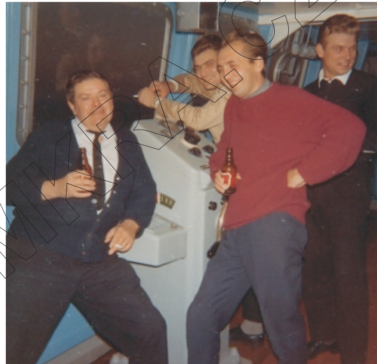
kapitán se šéfem strojovny