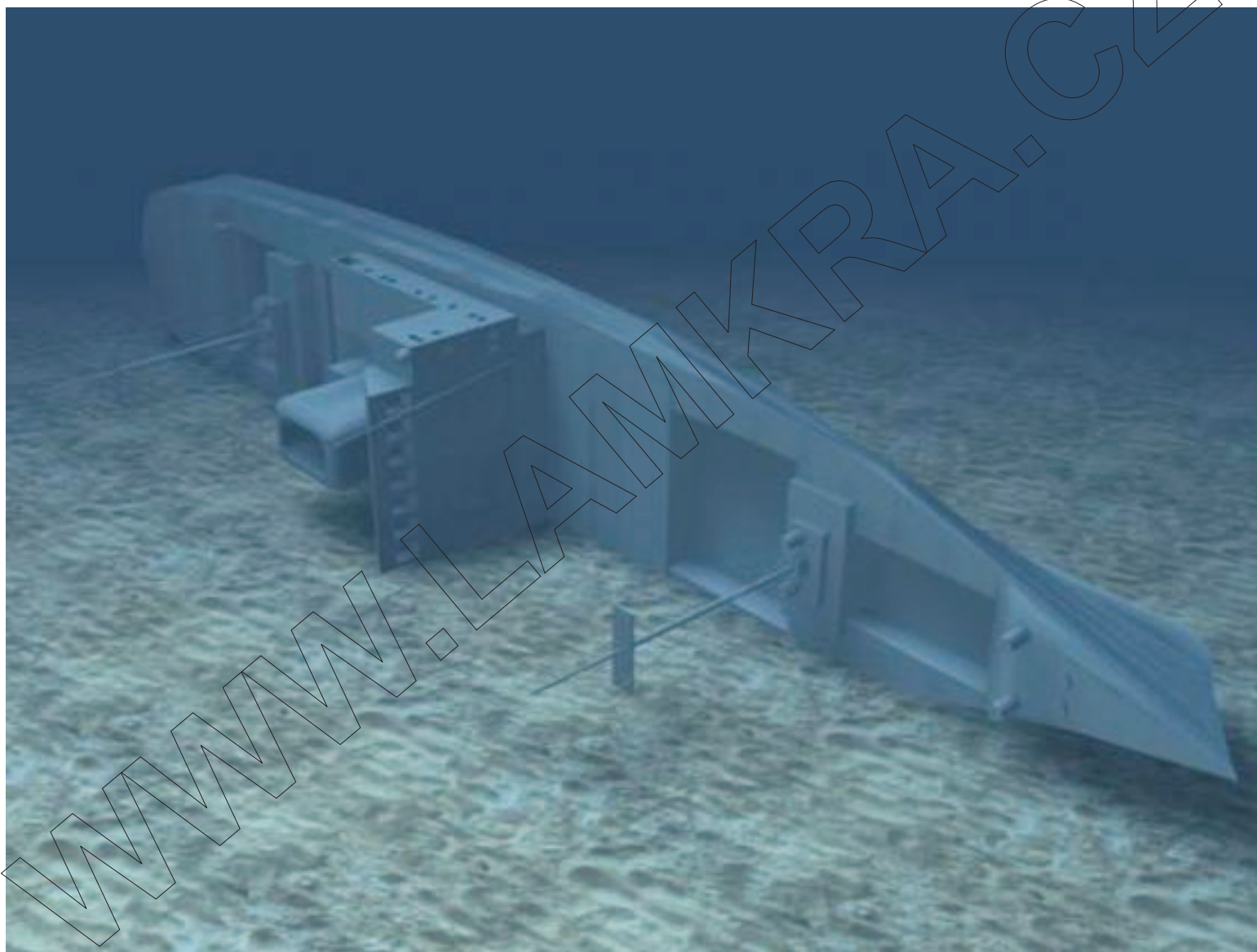
model - pohled od špičky